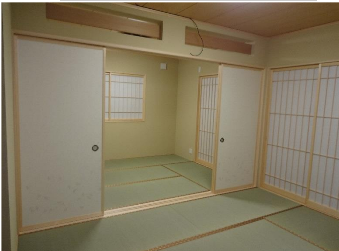
7月30日(木)に平屋建の家が完成しました。 少し変わった洋風調の2室続きの和室の写真です。