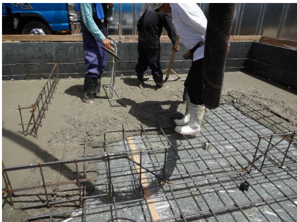
土間コンクリート打ち

三方原 A様邸新築工事の工事写真です。 弊社が販売した「大規模既存集落制度」対象地をご購入いただき、工事が 始まりました。 7月12日(日)に地鎮祭を行い、基礎工事が始まりました。 上棟日は8月5日(水)になります。