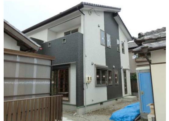
8月お引渡しの耐震壁体内通気循環工法の新津町のI邸