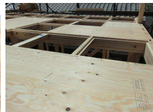
空気循環用仕切り棒の設置 → 内側より断熱材張り 地震に強い落とし蓋工法